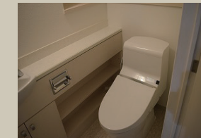
*家具はディスプレイ